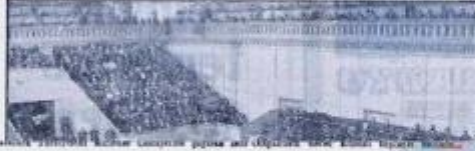
Bucaresta, Pazarın, Polonya, gökyüzü ve Yunanistan'ın... Bucaresta, Toul Zelanda, Ya.

Milletler Cemiyeti'nin 6 Temmuz 1932'de kabul ettiği kararlar, Atatürk Türkiye'sine bir çağrıdır. Bu çağrı, Milletler Cemiyeti'nin üyesi olan bütün devletlere gönderilmiştir. Atatürk Türkiye'sinin bu çağrıya katılması, Milletler Cemiyeti'nin kuruluşuna büyük katkıdır. Atatürk Türkiye'sinin bu çağrıya katılması, Milletler Cemiyeti'nin kuruluşuna büyük katkıdır.