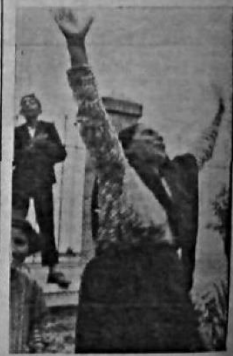
Türk askeri İskenderuna girerken

14-16 Aralık 1936'da toplanan Milletler Cemiyeti, Sancak Meselesi için üç kişilik gözlemci heyeti tayin etti. 20 Ocak 1937'de tekrar toplanan konsey İngiltere'nin Türk tezini desteklemesi sonucunda Sancak'ta ayrı bir statünün oluşturulmasını kararlaştırdı. Bu yeni